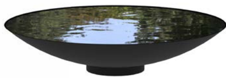
WASSERSCHALE BESCHICHTET STAHL