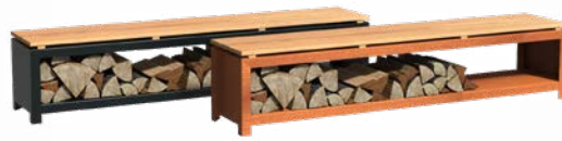
HOLZLAGER MIT SITZ